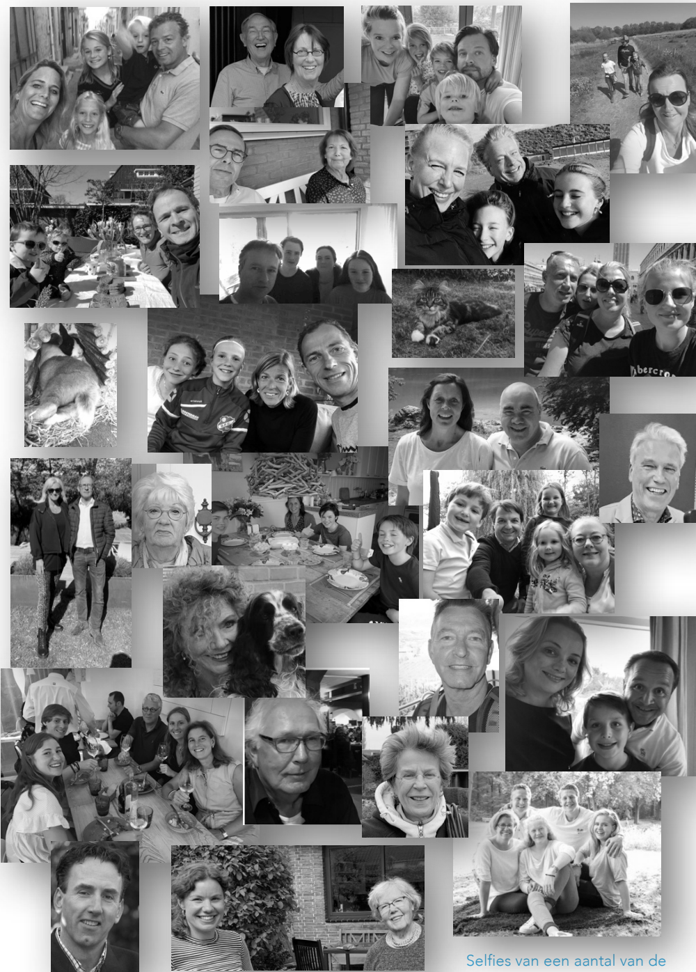
Selfies van een aantal van de leden van bewonersvereniging Mooi Naarden

Wij zijn Mooi Naarden en staan voor een leefbaar en duurzaam Naarden voor iedereen