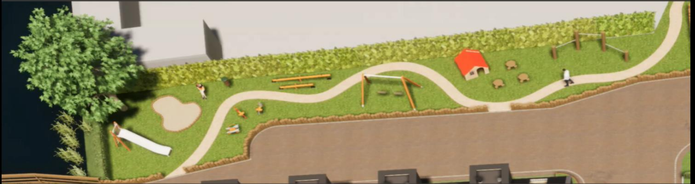
Zone 3 Voorbeeld: Klimtoestellen + verblijf + zandbak