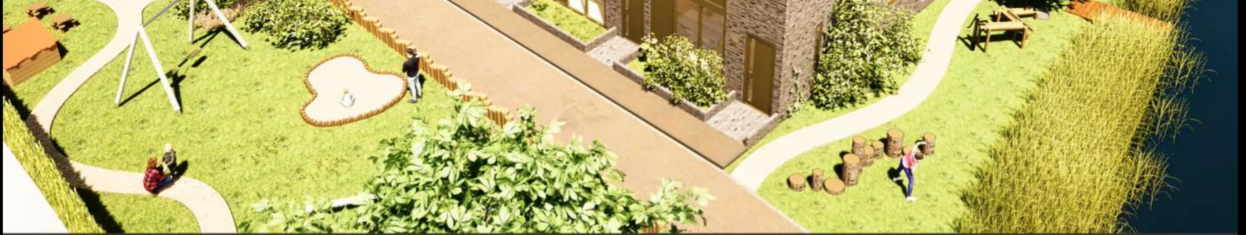
Zone 2 & 3 Voorbeeld: Klimtoestellen + verblijf + zandbak + bootcamp