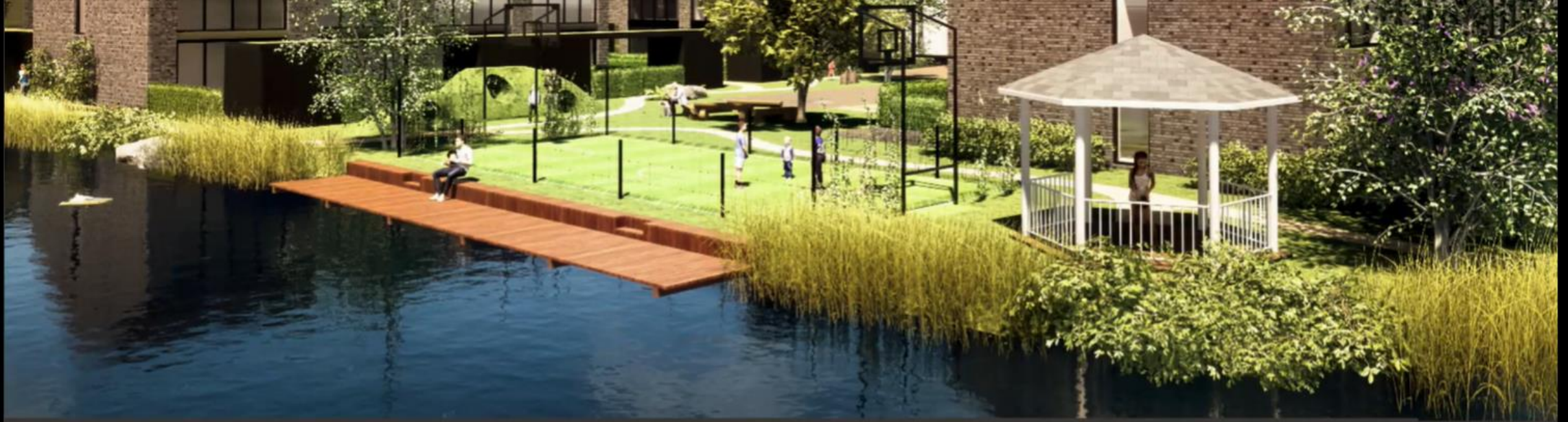
Zone 1 Voorbeeld: Verblijven, spelen & recreëren aan de waterkant