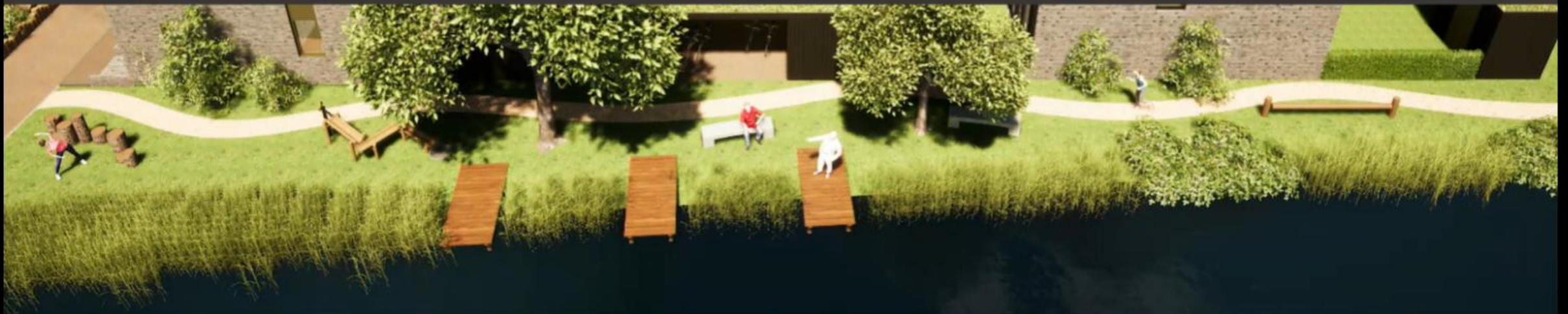
Zone 2 Voorbeeld: Verblijf + bootcamp + recreëren aan de waterkant