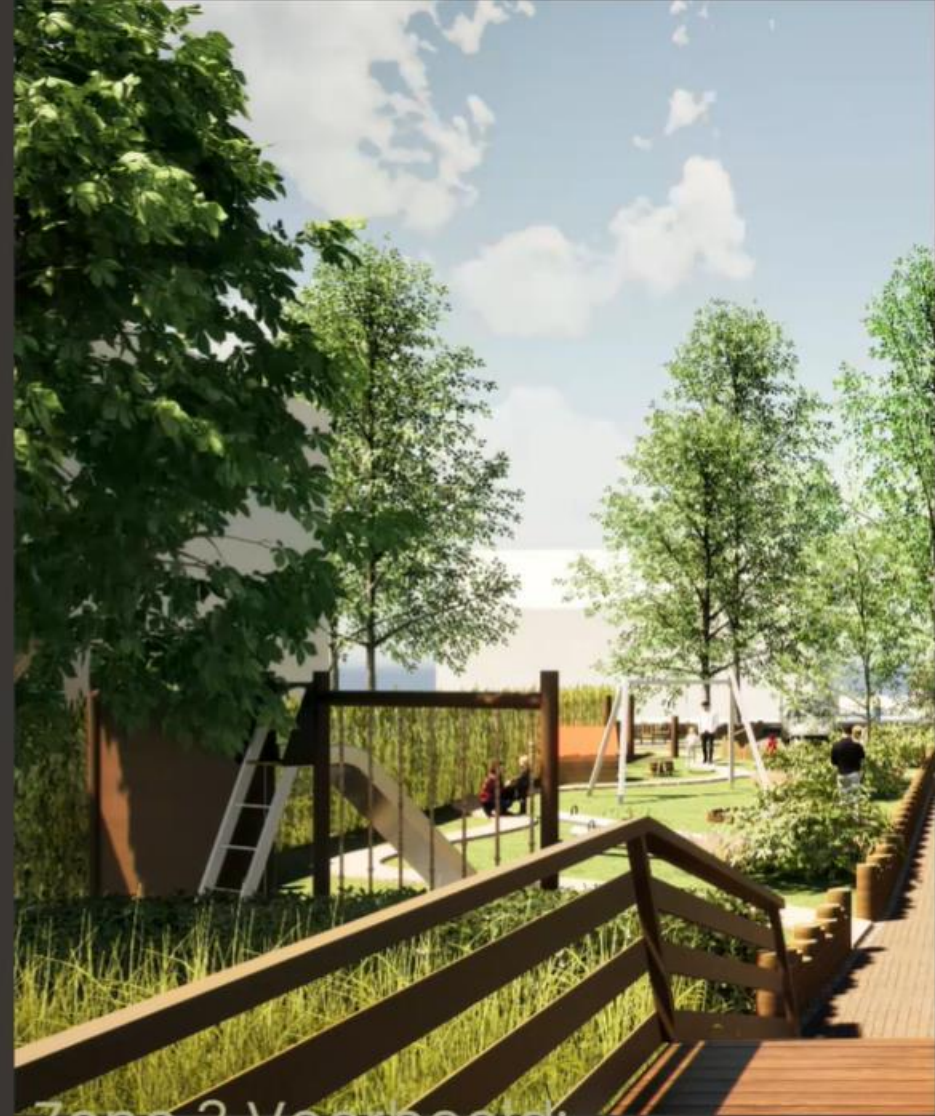
Zone 3 Voorbeeld: Veertoestellen + klimtoestellen + verblijf + zandbak