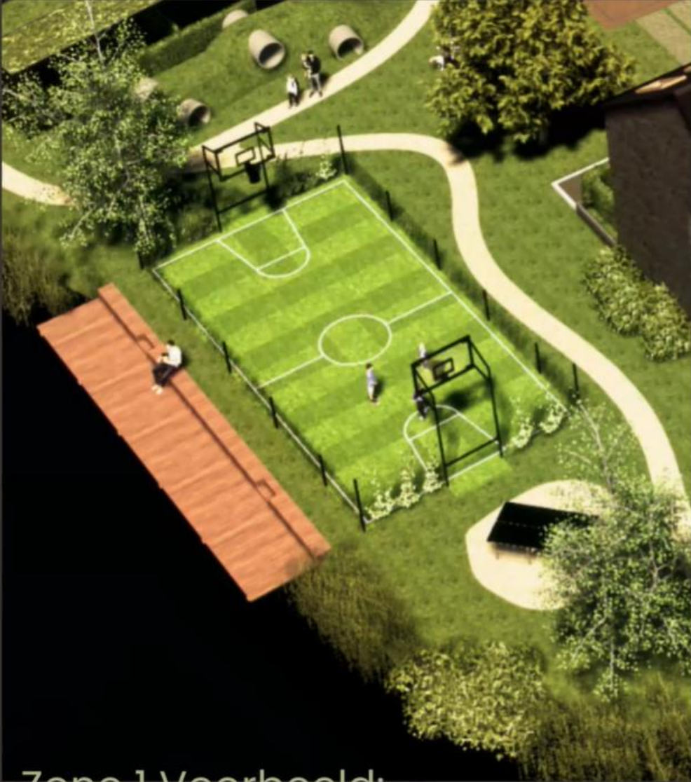
Zone 1 Voorbeeld: Basketbal/voetbalveld + parcours + wandelpad + vissen