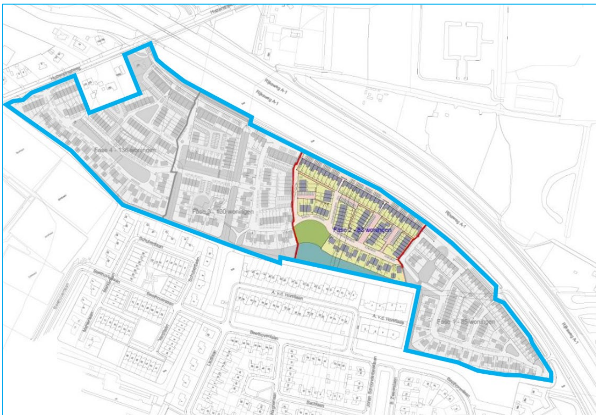
Afbeelding: Uitsnede BORgronden met fase 2 opgelicht

Op navolgende afbeelding is het plan weergegeven met een blauwe lijn, waarbij fase 2 is opgelicht.