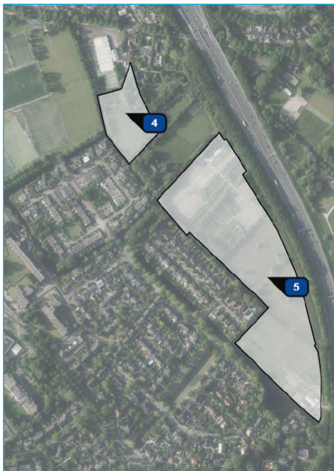
Afbeelding: Vlakken die bemest worden

In het plan zijn twee vlakken te onderscheiden die bemest worden. Navolgend zijn deze vlakken weergegeven met nummer 4 en 5.