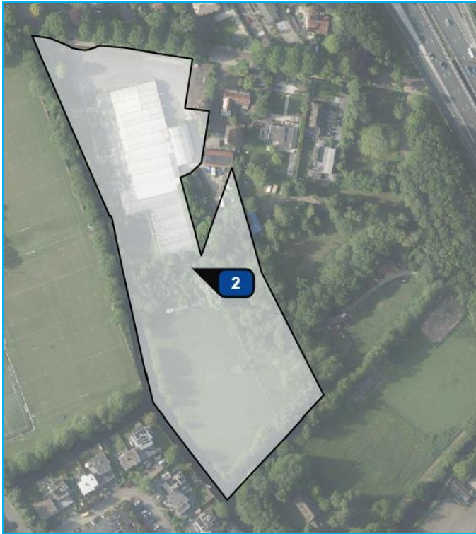
Afbeelding: Oppervlakte tuincentrum 2,35 ha

Hoewel het CROW uitgaat van de oppervlakte incl. buitenruimte, wordt in de toelichting uitgegaan van de buitenruimte die voor klanten toegankelijk is. Dit gedeelte is 1,0 hectare. Zie navolgende afbeelding.