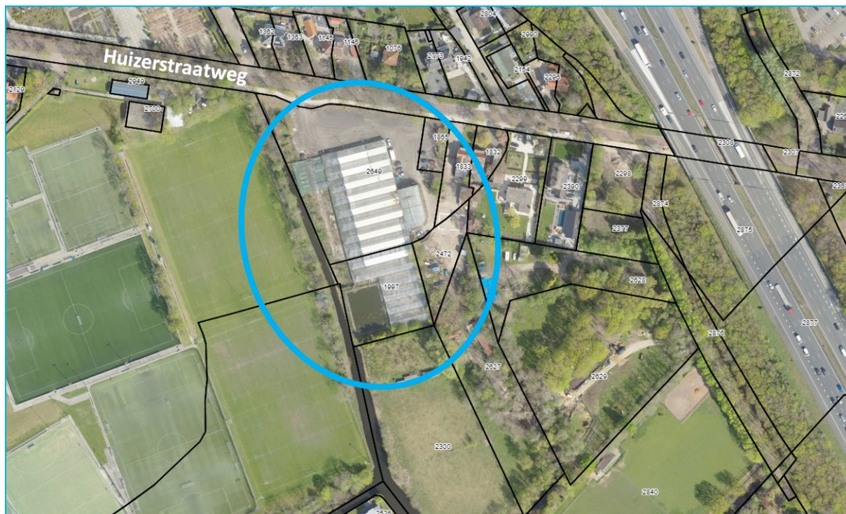
Afbeelding: Ligging tuincentrum Huizerstraatweg 97 Naarden

Op de afbeelding zijn de aanwezige opstallen van het tuincentrum en de agrarische gronden ten zuiden van het tuincentrum goed zichtbaar.