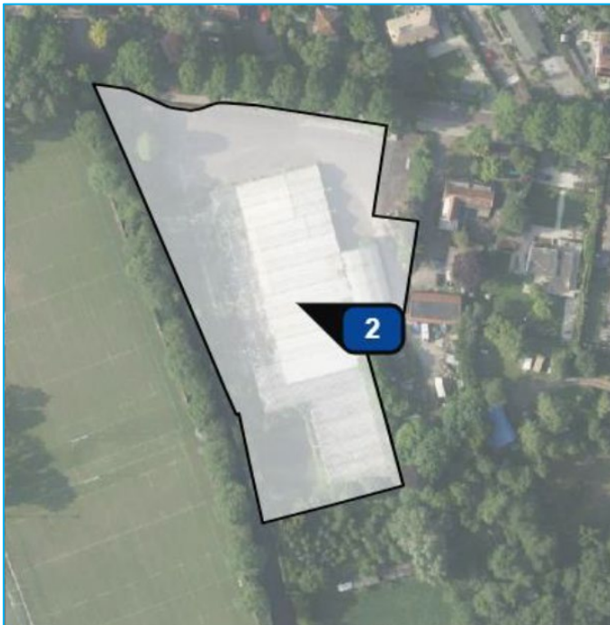
Afbeelding: Oppervlakte toegankelijke binnen- en buitenruimte (excl. kwekerij)

Het tuincentrum genereert daarmee ( 100 \times 15,2 = ) 1.520 motorvoertuigbewegingen per etmaal.