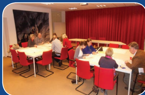
Impressie tweede avond

porten en onderzoeken die de deskundigen hebben ingebracht, zijn gebruikt om daaruit deze toekomstvisie voor het centrum van Bussum te formuleren.