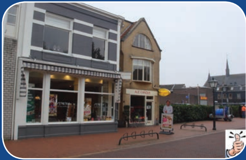
Sterk: Beeldbepalend pand