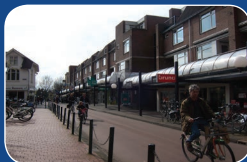
Fietsen in Bussum

enige discussie werd geconcludeerd dat Bussum in verhouding tot de rest helemaal geen auto is, maar een fiets: Bussum heeft een gevarieerde, hoog opgeleide bevolking, maar men is 'normaal' gebleven. Bussumers staan met beide benen op de grond, vinden duurzaamheid belangrijk en nemen veelal gewoon de fiets.