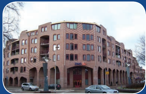
Hoek Kerkstraat en Landstraat