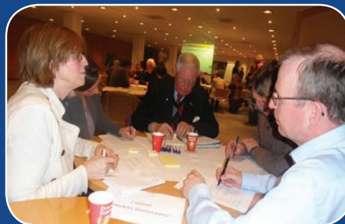
Impressie tweede avond