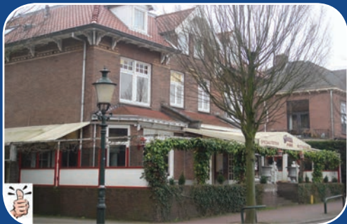
Sterk: Goede overgangen