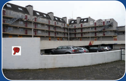
Zwak: Lelijke achterkanten

Op het gebied van mobiliteit is er ook wat ontevredenheid. Er is te veel (doorgaand) verkeer, vinden een aantal bewoners. Ook de splitsing van Bussum door een spoorlijn wordt als vervelend ervaren. Het is een fysieke tweedeling en zorgt voor opstoppen in het verkeer. Bovendien mist het centrum voldoende stallingsmogelijkheden voor fietsen, waardoor het nu vaak rommelig is. Ook wordt als belangrijk zwak punt van Bussum genoemd dat er in het centrum te weinig horeca is en een gebrek aan woningen, vooral voor jongeren en ouderen. Er is dus onvoldoende levendigheid in het centrum.