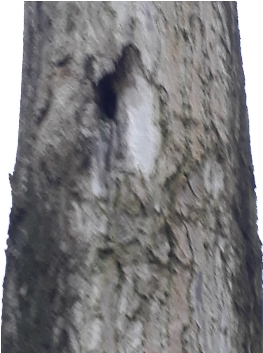
Ondiepe ongeschikte holte geïnspecteerd met zaklamp

Tijdens het veldbezoek werden geen nesten van broedvogels aangetroffen. Doordat al het blad van de bomen was, waren de bomen voor 100% te inspecteren. De bomen zijn niet in gebruik als verblijfplaats van broedvogels. In de bomen waren lokaal kleine holtes aanwezig. Deze holtes zijn ongeschikt voor vleermuizen. De holtes zijn allen te ondiep.