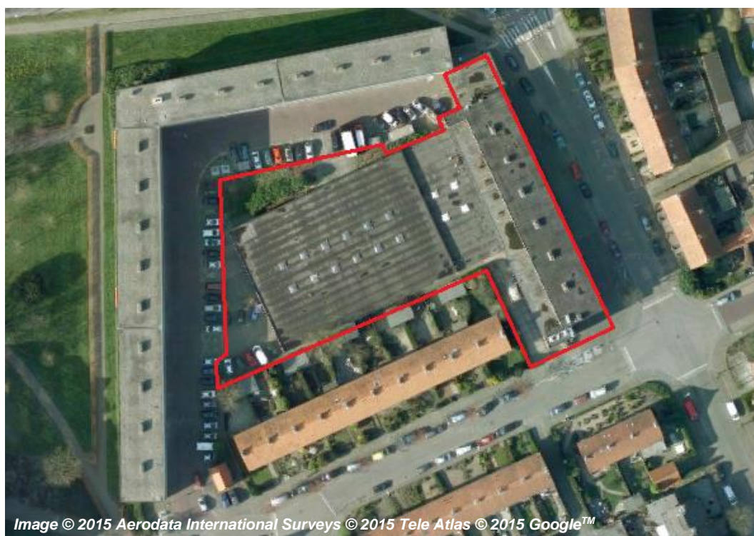
Afbeelding 1: Luchtfoto bestaande situatie plangebied (plangebied in rood kader, boven: globale ligging in groter verband, onder: gedetailleerde ligging in nabije omgeving)