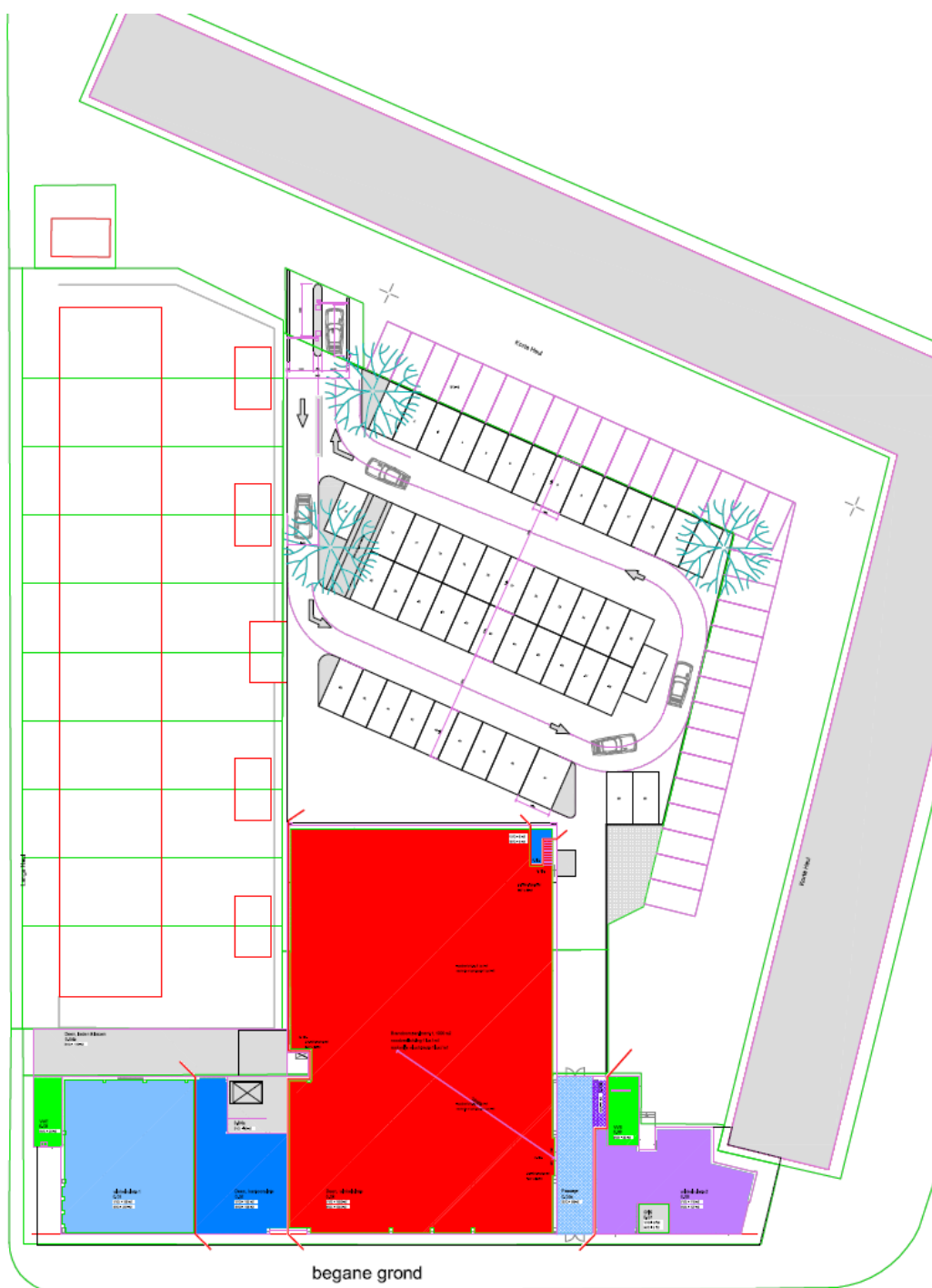
Afbeelding 2: Toekomstige situatie plangebied